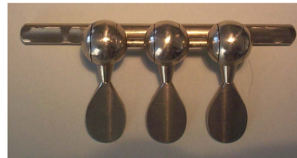
Druckwerk Modell Worischeck

Mundrohrdorn für Perinet-Trompete Dorn Flügelhorn-Anstoss Dorne konisch CNC gedreht